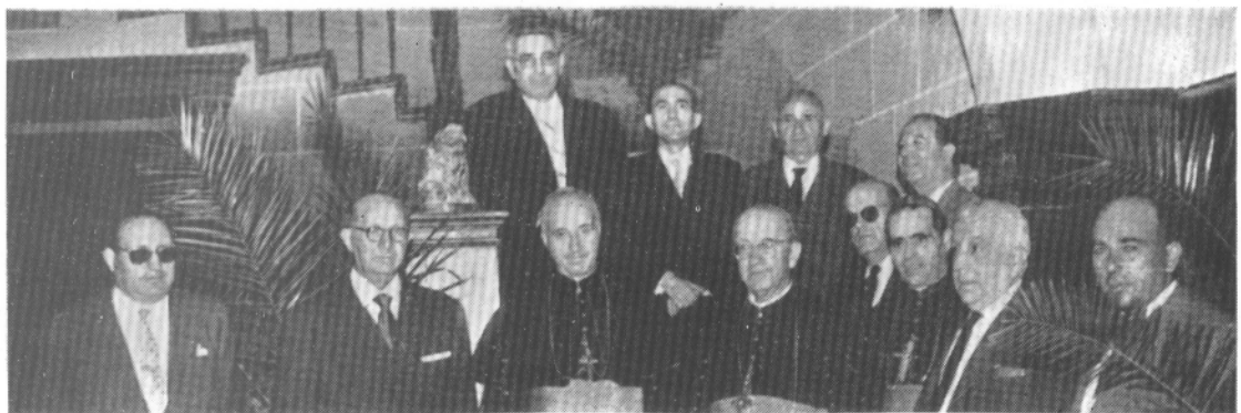
Directivos de la Institución con los tres Obispos sucesivos Consiliarios, grupo tomado a la terminación de los Actos conmemorativos del 50 Aniversario.