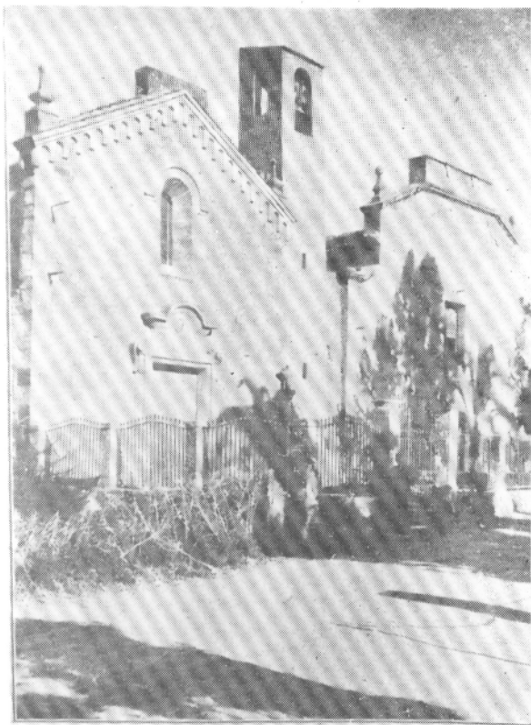
Iglesia-Convento de San Gregorio (desaparecido).