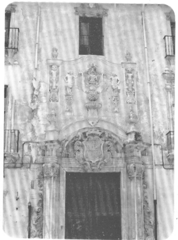
Antigua fachada Palacio de Pinohermoso, siglo XVIII (desaparecido).