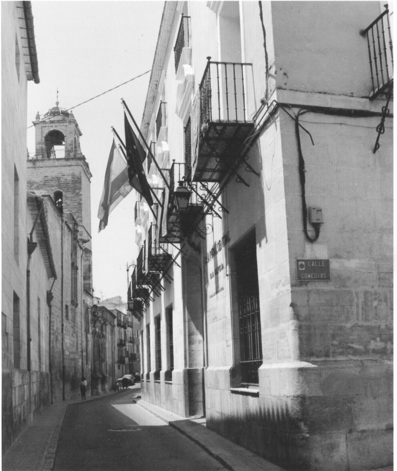
Fachada principal de la Sede Social de Caja Rural Central.